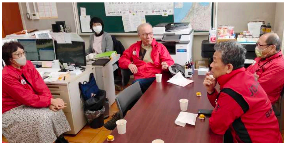
県栄養士会事務局を拠点に多彩な支援に注力

宮川 ●提供依頼書は、様式を工夫しました。提供依頼書は栄養士が日常使用する特殊栄養食品の通販カタログをベースに、濃厚流動食や嚥下調整食を区分けしました。日常使用している区分けの方が、現地で提供依頼書が記入しやすいと思ったからです。物資以外の工夫として、県外から支援に入るJDA-