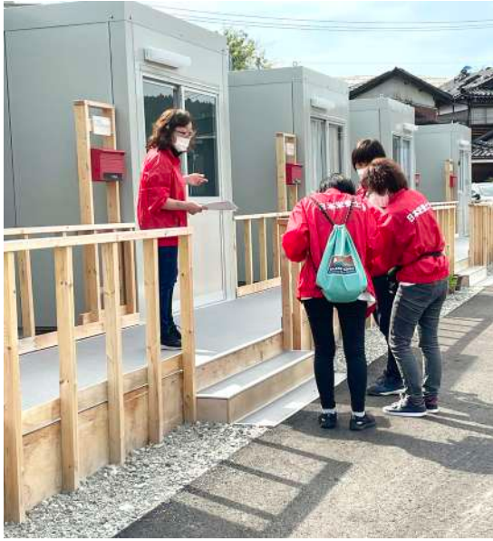
仮設住宅への栄養支援にも取り組んでいます

スープを飲まないようにしたいのですが、上下水道が使えず流すことができません。現地に支援物資で届いた給水ポリマーに汁を含ませて廃棄していた光景を目の当たりにして、現実を実感しました。