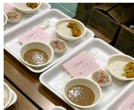
食中毒予防を目的に使い捨て容器を活用

坂下 ●1.5次避難所に関わらず災害の栄養支援においては、受援側としての県栄養士会の初動がとても重要だと感じました。1.5次避難所では、フリーランス栄養士が中心に初動にあたりま