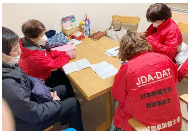
七尾市内の認定栄養ケア・ステーションに拠点を設置

平山 ●とても大変でしたが、現地に足を運んだからこそ知ることがたくさんありました。例えば、避難所でカップラーメンを食べる際、塩分が気になる人は