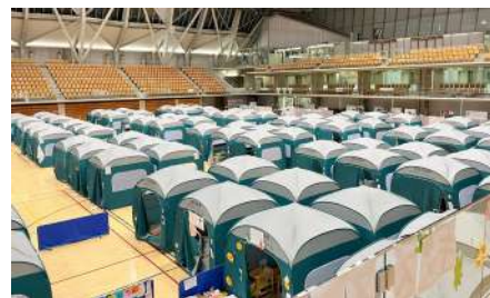
金沢市内の1.5次避難所で約6カ月の栄養支援

能登半島地震発生から1週間後、被災地で緊急的に避難する1次避難所から生活環境の整った安全な2次避難所へとつなぐ拠点として立ち上がった1.5次避難所で、石川県栄養士会は食に配慮を要する避難者への食事提供や栄養評価などに取り組みました。