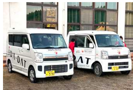
JDA-DAT 号も全国から集結

集まる栄養士が担いました。県外から続々と訪れる栄養士に対し、県栄養士会事務局は身を削る思いで調整を重ねていました。私は栄養支援を求める人にいかに物資や栄養士を結び付けるかを意識しました。そして七尾拠点から支援に入る栄養士がスムーズに活動で