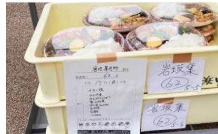
アレルギーに配慮し、原材料を表示

避難所でのアレルギー対応は近年、注目度が高まっており、欠かせない災害対策の一つです。石川県栄養士会では、食物アレルギーのある被災者に対応食品を届ける取り組みにも注力。県や市町、医療機関などと幅広く連携し、提供までの仕組みの構築にも知恵を絞りました。