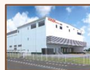
ナリコマシステム (CK方式)